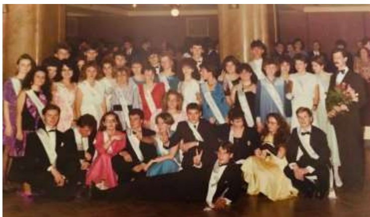
fotografie a pozvánka na VI. velmi radostný maturitní ples GNA 14. prosince 1989

Travel Writing, psaní reportáží o cestování. Za své příspěvky z USA a JAR získala 4 hlavní novinářské ceny Ringier. Každoročně vede česko-anglický Festivalový deník na MFF Karlovy Vary. Pod názvem Má americká krása jí vyšly kniha i audiokniha reportáží o USA. Je vdaná a má dvě dcery, Anežku a Ellu.