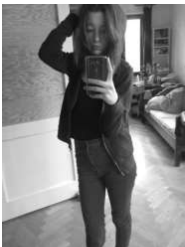
2014 bylo krušný období

V dětství a obzvláště dospívání jsem udělala hodně věcí, který mi teď přijdou neskutečně hloupý, nesprávný nebo trapný, ale upřímně se snažím v životě ničeho nelitovat. Člověk by si měl uvědomit, že to byla chyba a ponaučit se z ní, ale litovat něčeho a utápět se ve starostech z minulosti je zbytečný. Jako jasný, všechny svoje "krindži" selfička a otřesnej styl oblékání (kombo neonově žlutýho trička a neonově růžovejch kalhot bylo top), hrůznej hudební vkus (omg miluju One Republic a Bruna Marse - bez urážky samozřejmě) a trapný mezilidský interakce (jako joo, budem si na fíbičku psát celou noc, ale ráno v autobuse se ani nepozdravíme), bych nejradši vzala zpět, ale díky tomu jsem teď taková, jaká jsem a můžu se tomu akorát zasmát.