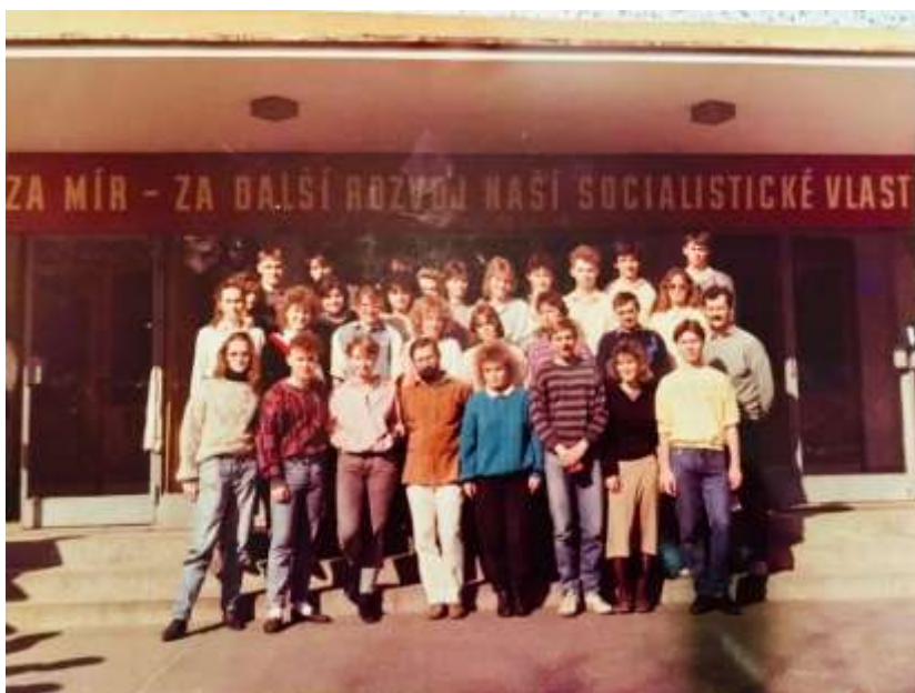
Fotografie 3.D z června roku 1989 před hlavním vchodem do gymnázia Veronika je třetí ve druhé řadě zleva

zametou,“ ale i takový strach nám byl cizí. Spolužáky, co jim to „doma nedovolili“ jsme – po válečné poradě v Restauraci u Holečků u obory Hvězda - s sebou na demonstraci jednoduše vzali. Bylo nám už sedmnáct, tak jaképak zakazování.